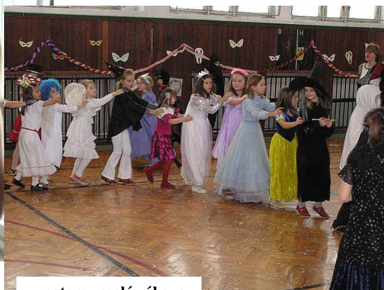
... potom veselá zábava