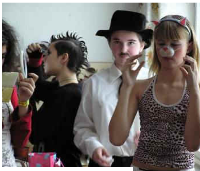
Najprv dôkladná príprava .....

Čas maškarných plesov a karnevalov je tu. 17. februára sa to v škole len tak hemžilo rôznymi rozprávkovými i prečudesnými bytosťami. Po dôkladných prípravách sa všetky masky sústredili v telocvični a karneval mohol začať.